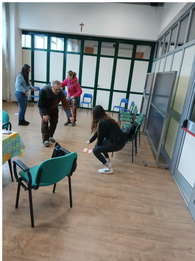
Figura da 1 a 4 – Attività creative durante il terzo incontro presso la sede dell'Oratorio Spirito Santo a Pinerolo.

Quarto incontro – La vetta Svoltosi presso la sede di Via Rodi, il quarto incontro ha affrontato il tema della vetta, intesa come futuro. In questa occasione i gruppi sono stati unificati, favorendo un momento di condivisione più ampio.