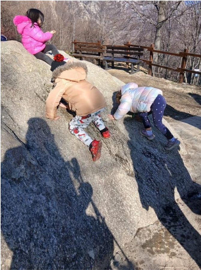
Figura da 1 a 3 – Giornata conclusiva “insieme verso la vetta”, svoltosi presso Casa Canada.

Conclusioni Il percorso ha favorito momenti di riflessione, condivisione e rafforzamento delle competenze genitoriali, valorizzando al contempo la dimensione relazionale e ludica.