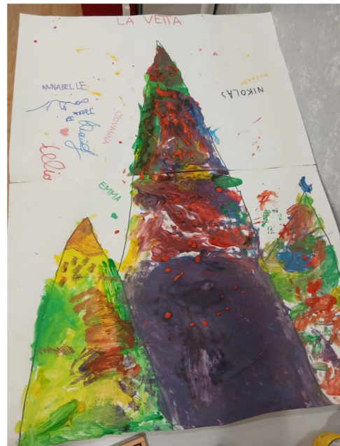
Figura da 1 a 4 – Attività creative durante il quarto incontro presso la sede di Via Rodi, Pinerolo.

Cooperativa Sociale di Solidarietà Promozione Lavoro