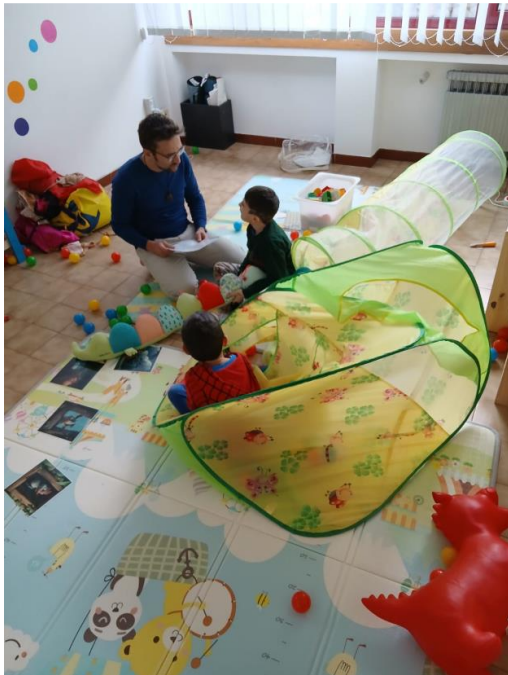
Figura da 1 a 3– Attività creative e conviviali durante il secondo incontro presso la sede educativa della Val Pellice.

Cooperativa Sociale di Solidarietà Promozione Lavoro